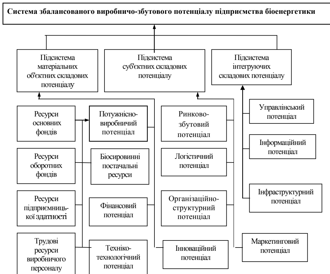
Рис.3. Структурно-функціональна модель складових збалансованого виробничо - збутового потенціалу підприємства біоенергетики *

Тому вважаємо, що найбільш прийнятним до розуміння структури системи ЗВЗП підприємства біоенергетики є саме функціональний напрям її формування (див. рис.3).